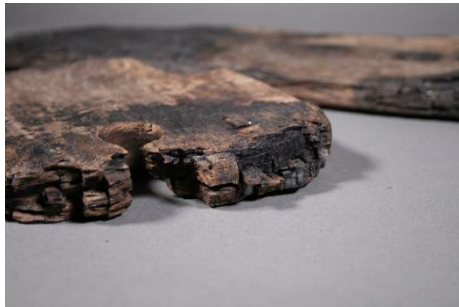
Bois brûlé par l'incendie des années 1020