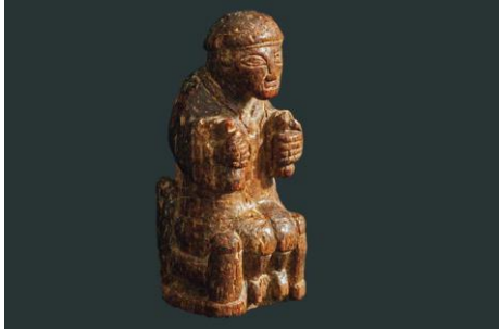
Pièce d'échec, os, XIe-XIIe s., coll. Musée de l'ancienne abbaye