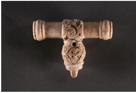
Tau (poignée du bâton d'un abbé), XIe siècle, coll. Musée de l'ancienne abbaye.